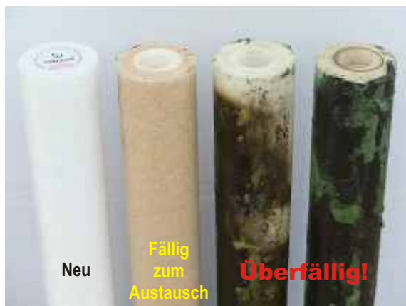
Abb.1: Tiefenfilter 1µ.

Der rechtzeitige Austausch der Filter ist die Grundvoraussetzung für das Funktionieren jeder Wasseraufbereitung. Banal? Das dachten wir auch. Die folgenden Abbildungen zeigen jeweils (von links nach rechts) einen neuen Filter, ein normal verschmutztes Exemplar, das ausgetauscht werden sollte, sowie extrem verdreckte und veralgte Filter, die längst hätten ausgetauscht werden müssen. Unser Kundendienst ist regelmäßig mit derart vernachlässigten Anlagen konfrontiert. Die Auswirkungen auf die nachfolgenden Hochdrucksysteme kann sich jeder ausmalen.